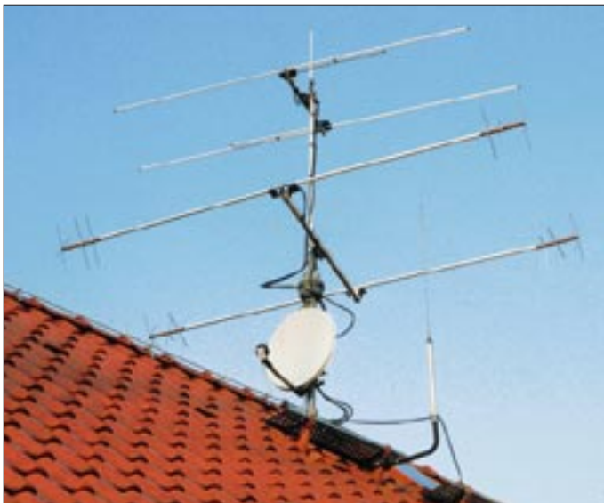
Bild 1: Miniantenne in etwa 2 m Höhe über dem Dach. Darüber befinden sich noch eine HB9CV für 6 m und ein VHF-/UHF-Rundstrahler.

sowie ein langer Draht zwischen den Bäumen waren nicht genug – irgendetwas Drehbares für die oberen KW-Bänder mußte her. Das eigene physikalische Verständnis für die Wirkungsweise von Antennen war durch 25 Jahre Antennengebästel soweit geschärft, daß verkürzte An-