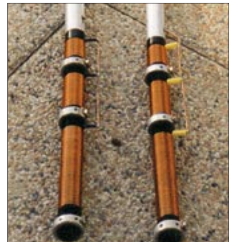
Bild 4: Verlängerungsspulen mit den Ringen für die Anbringung der Speichen

erzeugt. Und das tut es. Für den endgültigen Antennenstandort auf dem Hausdach wurde mittels Dipper in 150 m Entfernung das Vor-Rück-Verhältnis bestimmt sowie die minimalen bzw. maximalen Pegel bei 90° abgewandter Antenne. Bei aller Ungenauigkeit läßt sich ein reales Vor-Rück-Verhältnis von 8 bis 10 dB erreichen. Stationen aus dem Strahlungsminimum fallen je nach Entfernung um bis zu 25 dB leiser ein.